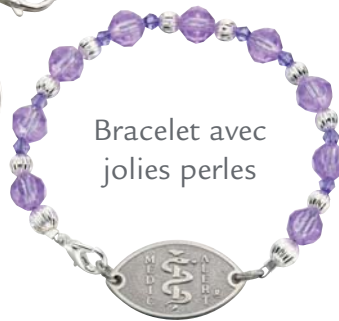
Bracelet avec jolies perles