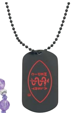
Plaque d'identification laquée en noir

La montre, le bracelet avec médaillon en argent, le bracelet avec les jolies perles et la plaque d'identification laquée en noir MedicAlert® sont conçus pour être facilement reconnus par les premiers intervenants et le personnel de la salle d'urgence. Ils affichent le symbole de renommé internationale sur le recto et les renseignements médicaux facilement accessibles gravés à l'endos.