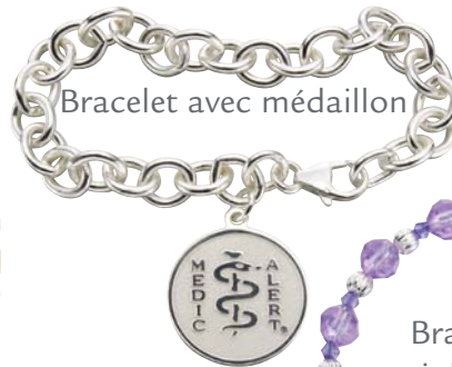
Bracelet avec médaillon